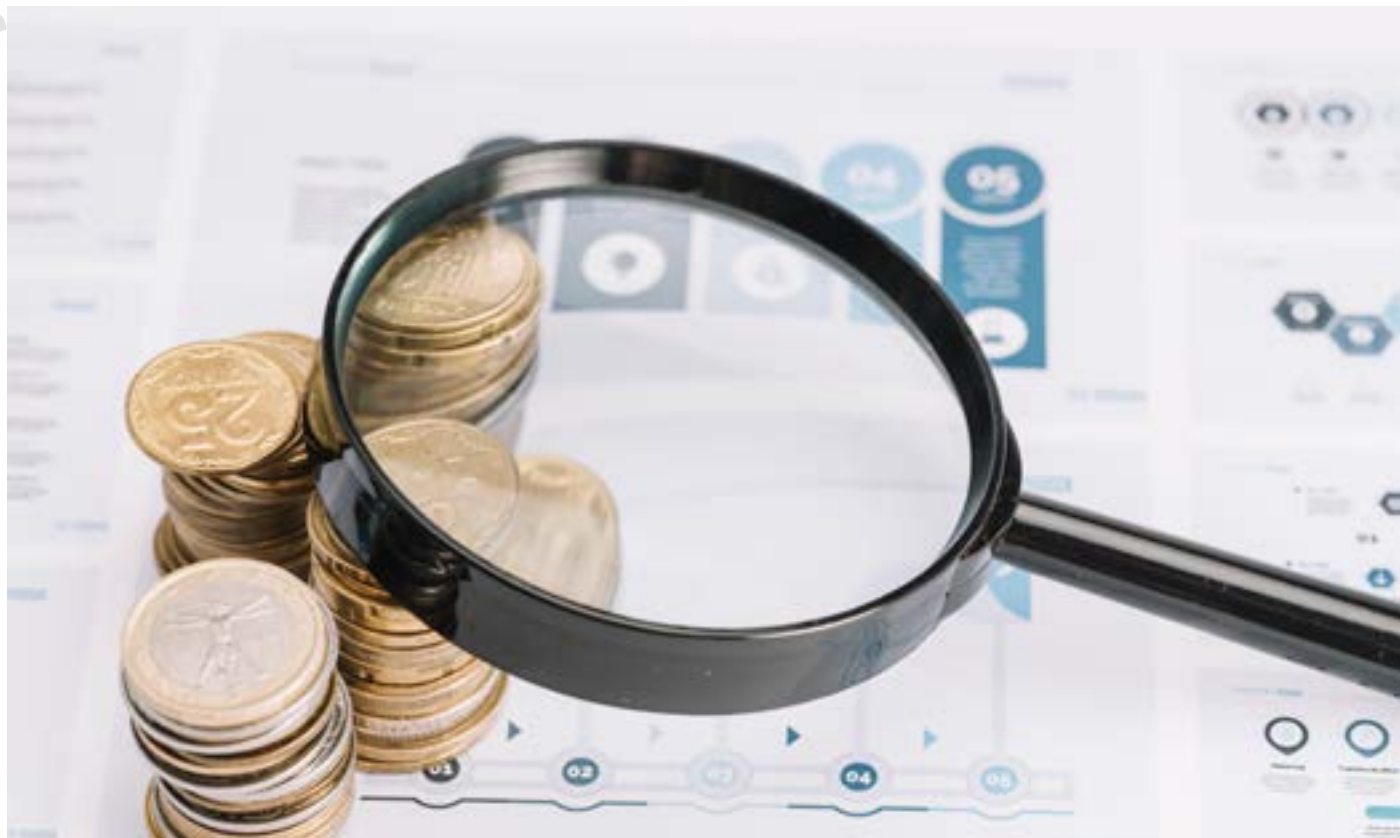
▲ Digitale Tresorverwaltung schafft einen Gesamtüberblick über den Bargeldbestand / Digital safe management creates a complete overview of the cash holdings